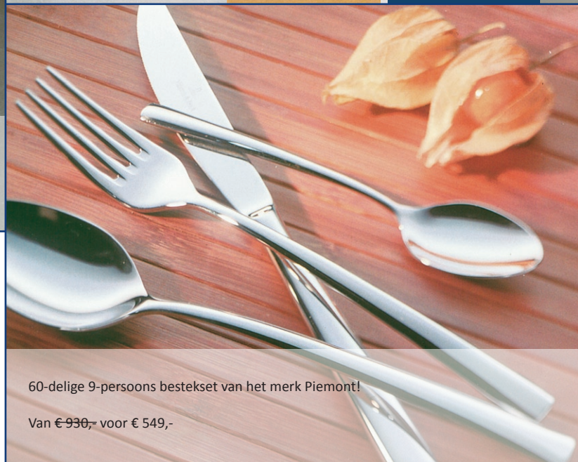
60-delige 9-persoons bestekset van het merk Piemont!