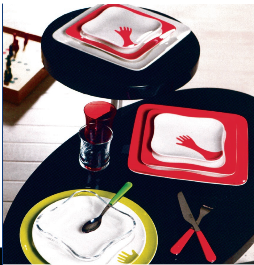
Ik eet, ik drink, ik leef!

Is de slogan van het unieke vivo design van Villeroy & Boch verkrijgbaar bij de Verleiding!